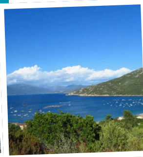
Golfe de Valinco