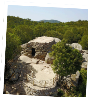
Site préhistorique de Cucuruzzu