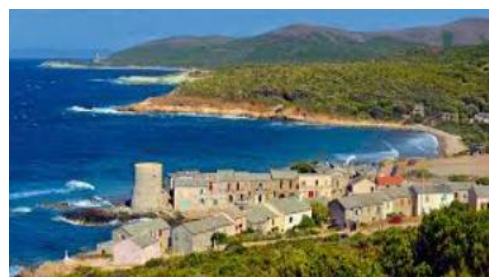
Le Cap Corse