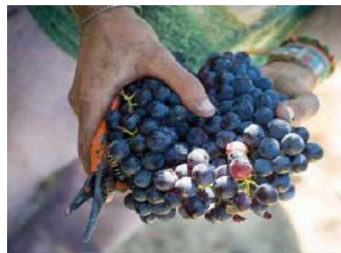
Vignoble de Patrimonio

Départ du club à 9h00 pour le Transfert vers l'aéroport de Bastia.