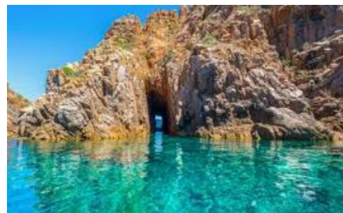
Calanques de Piana