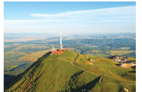
Le Puy de Dôme