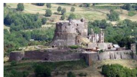
Château de Murol