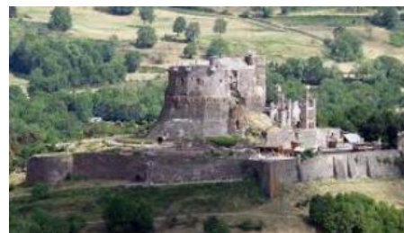
Château de Murol