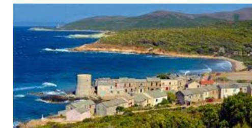
Le Cap Corse