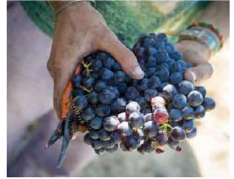
Vignoble de Patrimonio

Petit déjeuner. Transfert vers l'aéroport de Bastia.