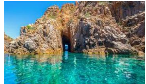
Calanques de Piana