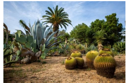
Jardin tropical de Blanes