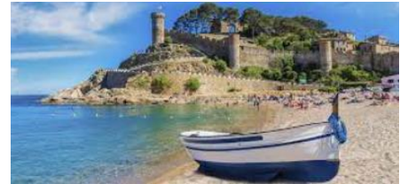
Tossa de Mar