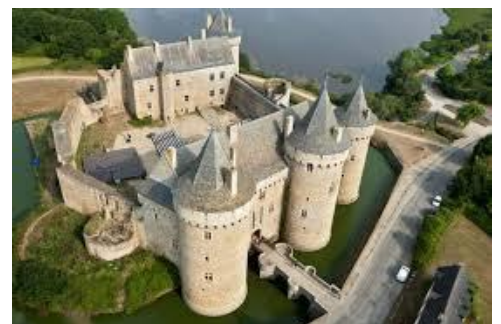
Château de Suscinio