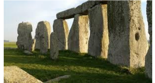
Mégalithes à Carnac