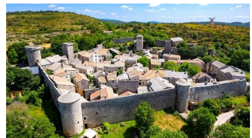
Cité templière de la Couvertoirade