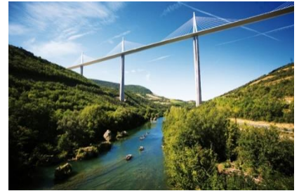
Viaduc de Millau