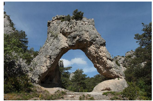
Chaos de Montpellier le Vieux

Départ après le petit déjeuner et fourniture d'un panier repas à emporter