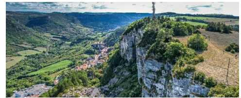
Gorges du Tarn