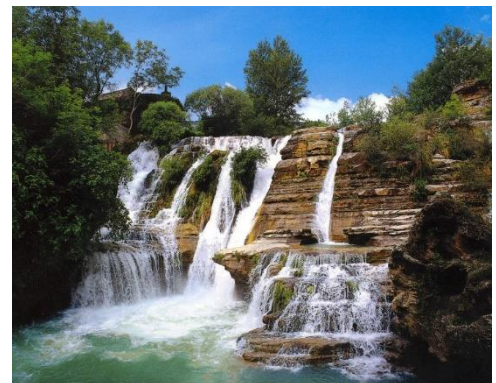
Cirque de Navacelles