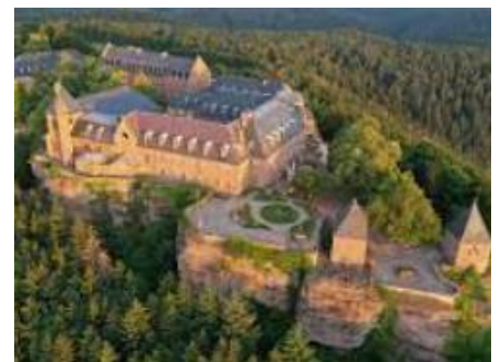
Monastère du Mont Sainte Odile