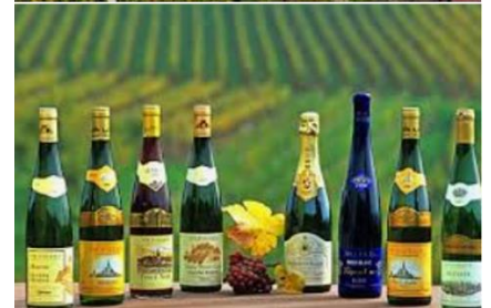
Route des vins d'Alsace