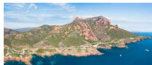
La Corniche d'or