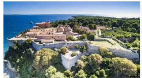
Fort de l'île Ste Marguerite

Départ après le petit déjeuner et fourniture d'un pique-nique à emporter pour le déjeuner