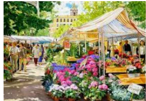
Marché aux fleurs de Nice