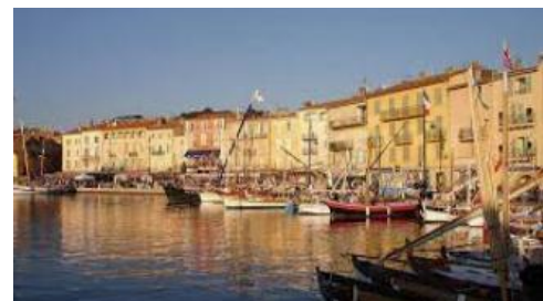
Vieux port de Saint Tropez