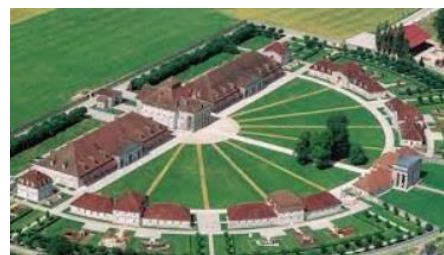
Saline Royale d'Arc et Senans