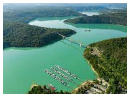
Le Lac de Vouglans