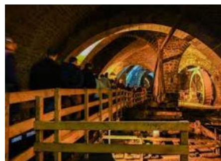
La Grande Saline