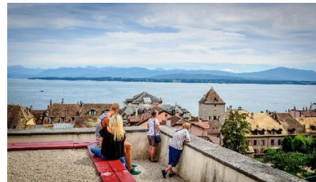
Nyon et le Lac Léman