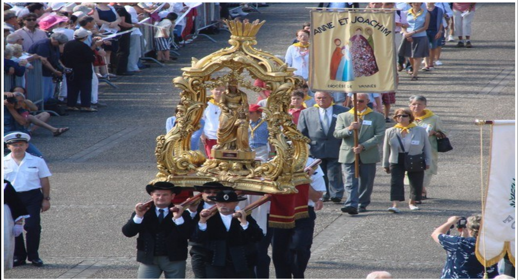
Procession de Sainte-Anne.