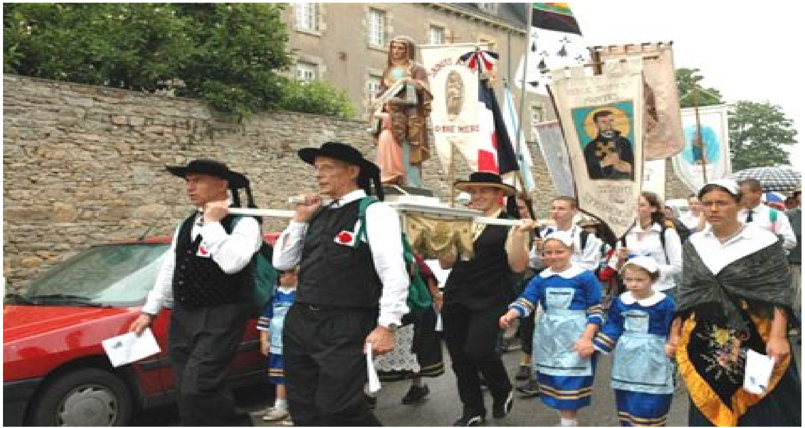
Procession à Sainte-Anne d'Auray.