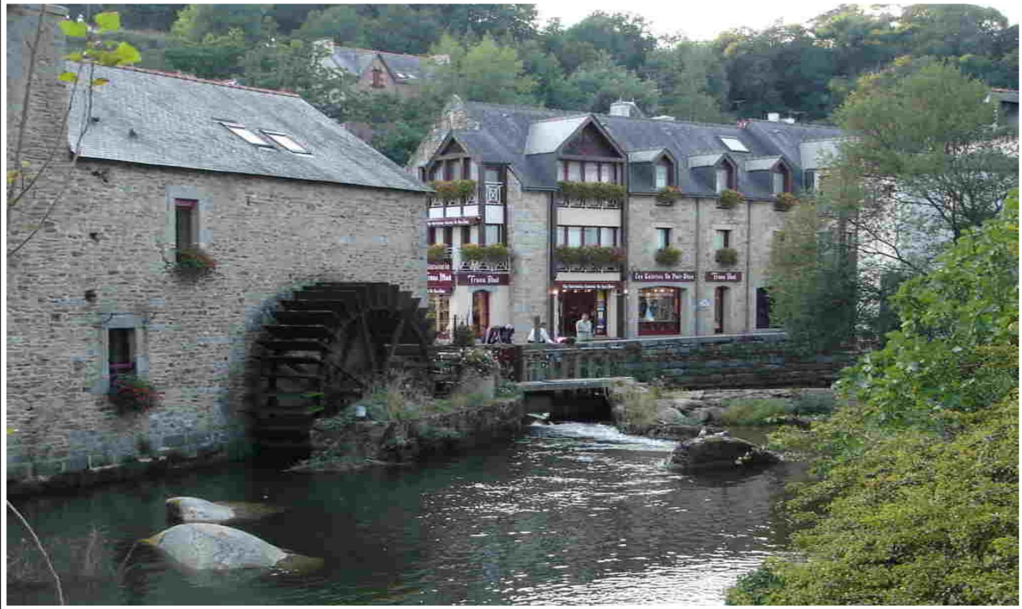
Pont Aven, moulin à roue.