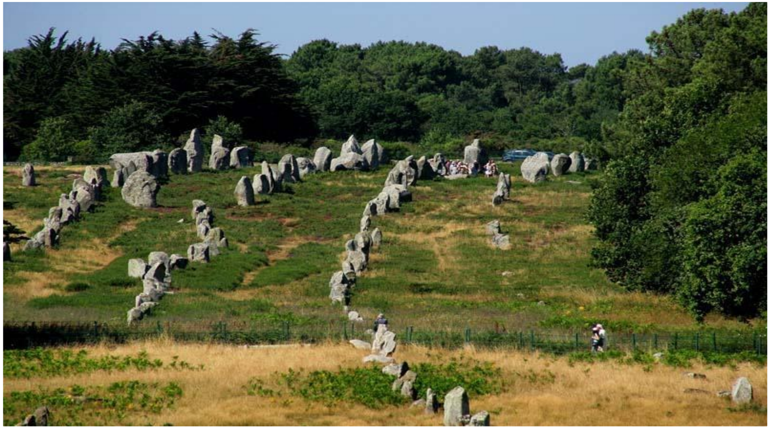
Les alignements de Carnac.