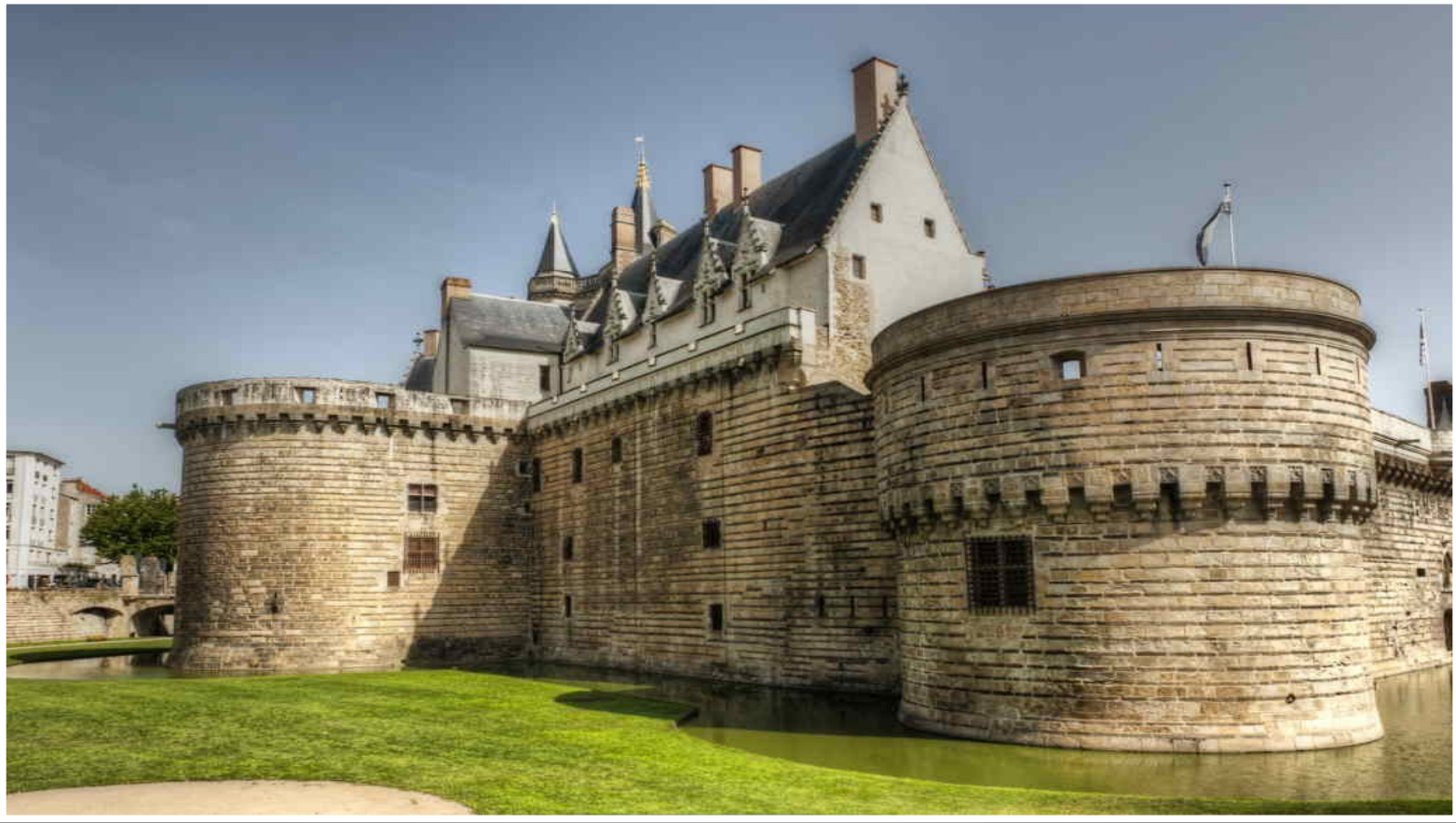
Château de la Duchesse Anne.