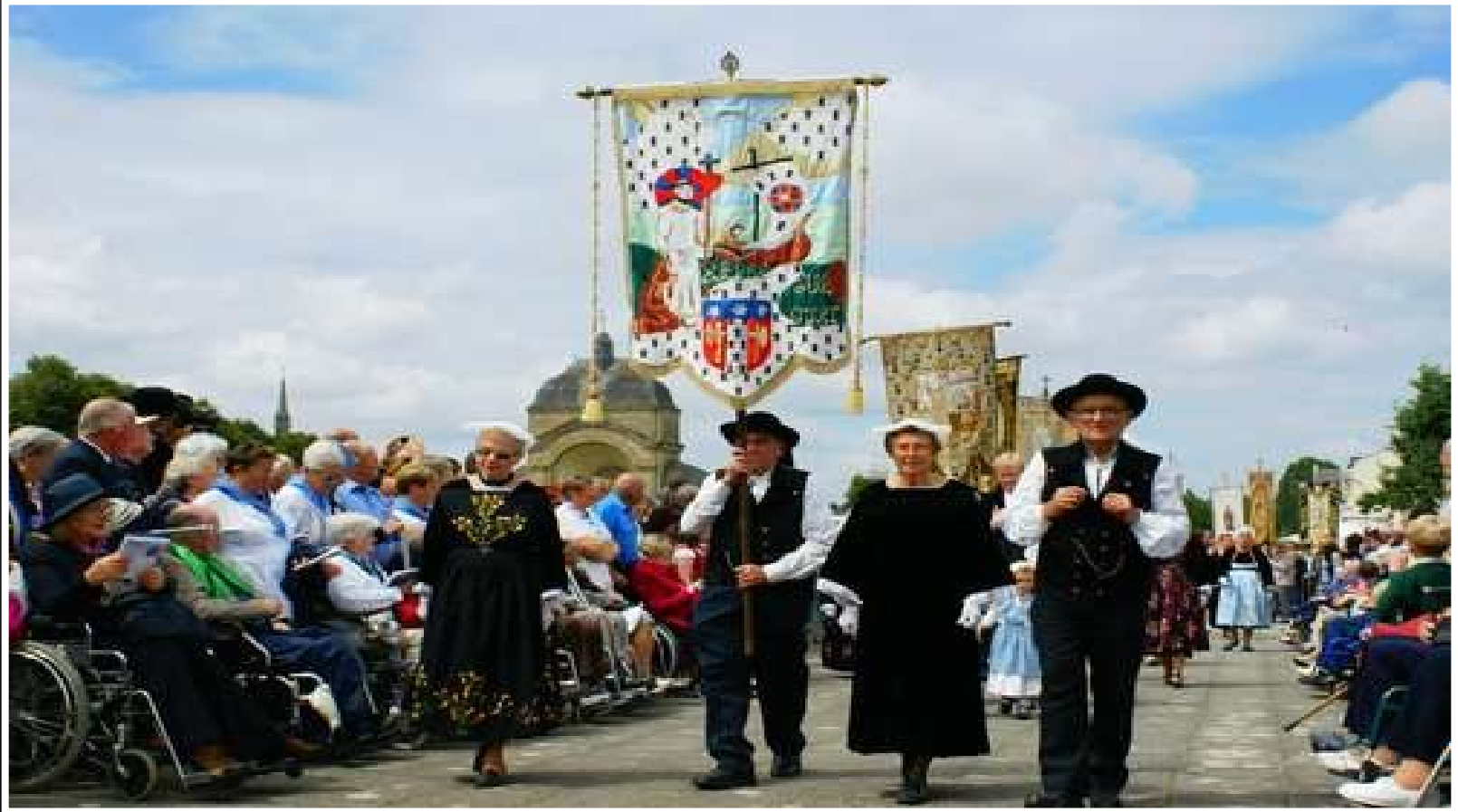
Procession de Saint Anne à Auray.