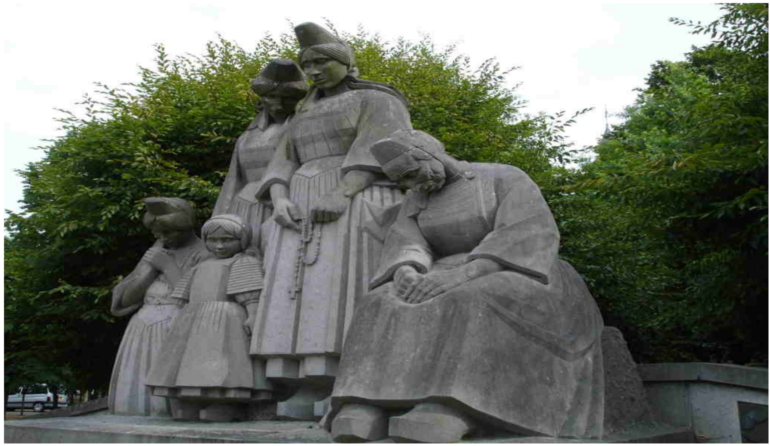
Monument aux bigoudènes.